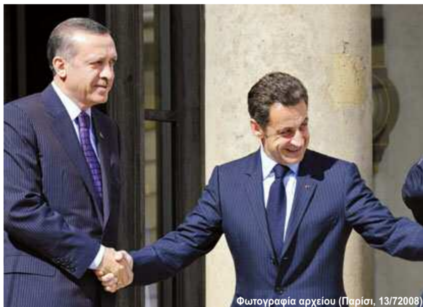
Φωτογραφία αρχείου (Παρίσι, 13/7/2008)

‘Ο κ. Σαρκοζί άλλα λέει από την Γαλλία, άλλα από την Αρμενία και άλλα από την Τουρκία’